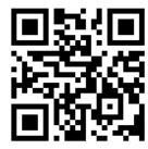
QR Code ลงทะเบียน CM-CHANA