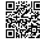
QR Code: CMU SELF HEALTH CHECK FOR COVID-19