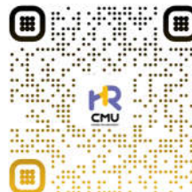
ระบบสมัครงานอิเล็กทรอนิกส์ (CMU HR e-Recruitment)