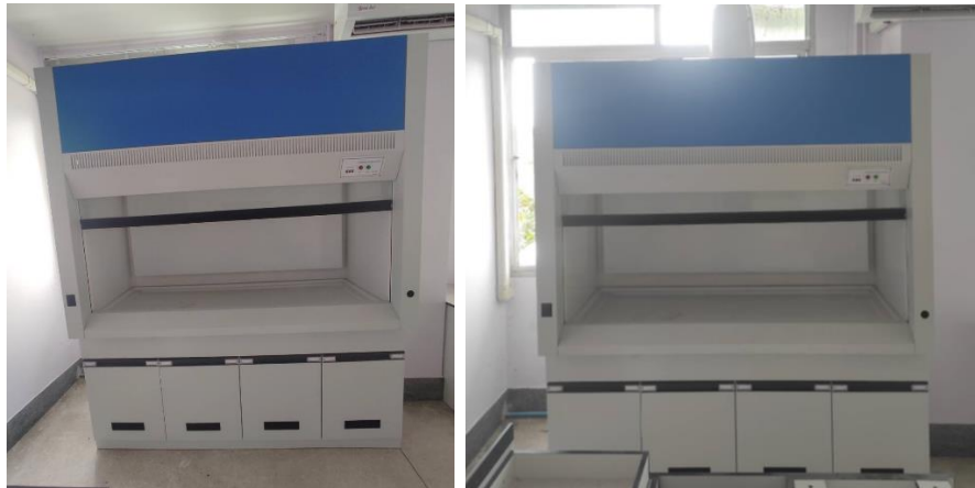
รูปประกอบ 1 ตู้ดูดควัน (FUME HOOD) ในส่วนงานที่ดำเนินการแล้วเสร็จ

1.8.2 การเดินท่อควัน ต้องเดินท่อจากหลังตู้ควันไปยังพัดลม ซึ่งติดตั้งอยู่ภายนอกอาคารและปลายท่อต้องติดตั้งอุปกรณ์กันน้ำฝน กันนก