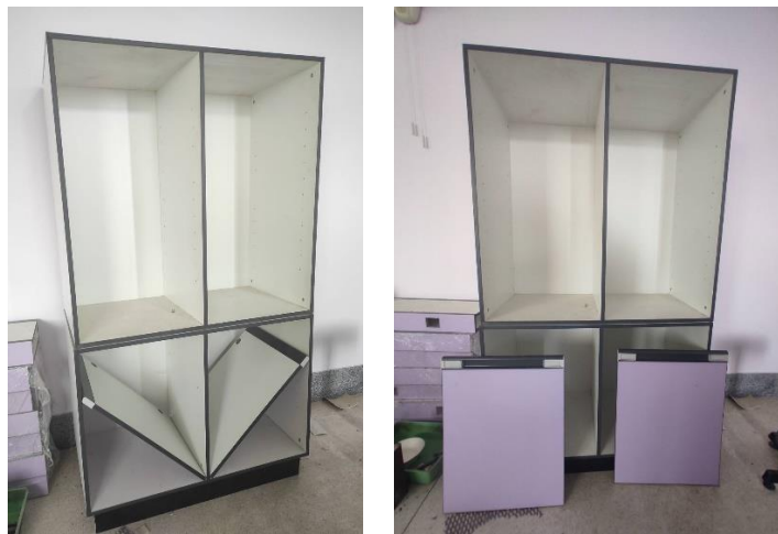
รูปประกอบ 2 ตู้เก็บอุปกรณ์ ในส่วนงานที่ดำเนินการแล้วเสร็จ